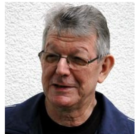
Bischof Erwin Kräutler wurde 2010 für seinen langjährigen Einsatz für die indigenen Völker Brasiliens mit dem Alternativen Friedensnobelpreis ausgezeichnet.

Die weiße Hostie bleibt die leuchtende Mitte. Sie ist das Zeugnis des bezwungenen Todes, schenkt Hoffnung wider alle Hoffnung, erweckt Liebe ohne Grenzen. Sie glüht weiter und wird immer lichtvoller. Sie vertreibt die Finsternis aller Nächte, verjagt die Dunkelheit aus unseren Herzen.